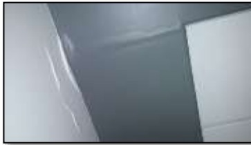
IMAGEN # 1 PINTURA DE PARED Y CENEFA DETERIORADAS POR LA FILTRACIÓN DE AGUA 2º PISO, SALA DE ESTAR