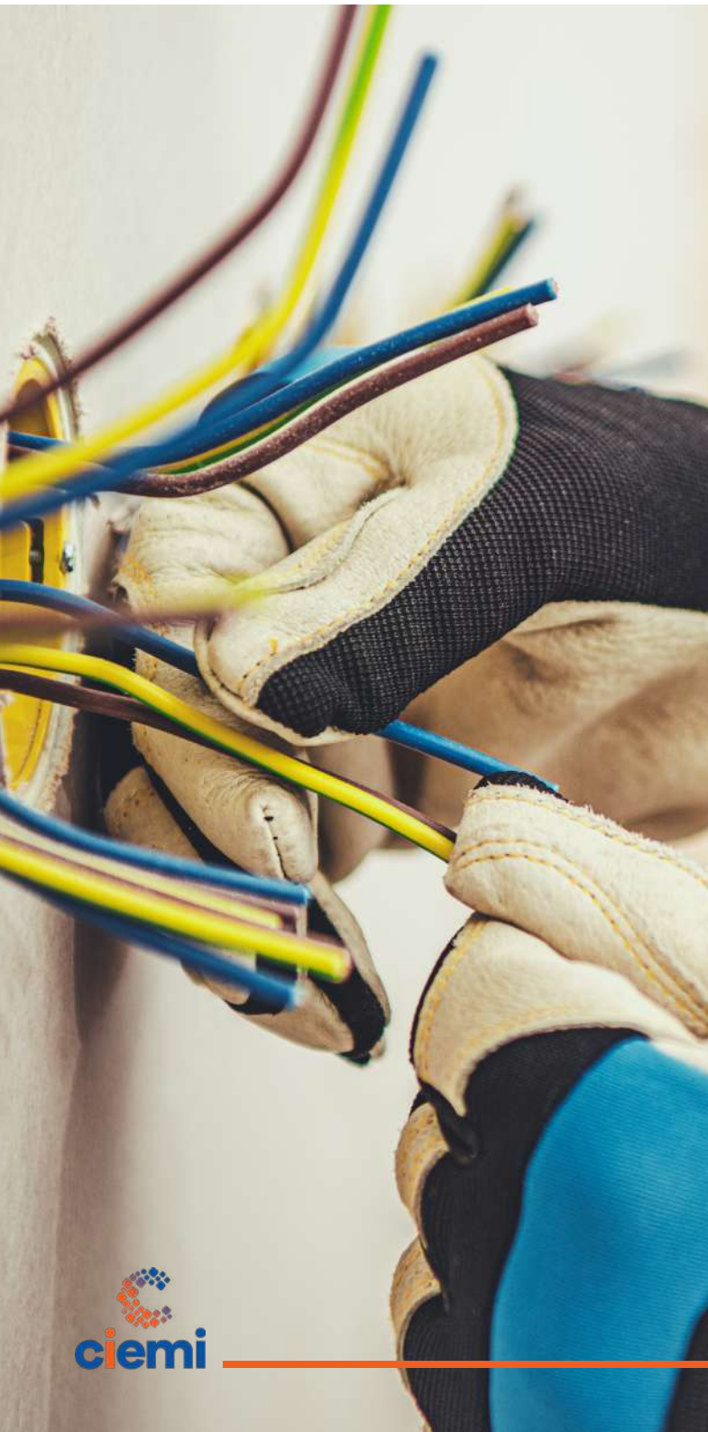
Tabla de Equivalencia para motores eléctricos

Artículo 3°- Apruébese la siguiente Tabla de Equivalencia para Motores Eléctricos, como parte integral del "Código Eléctrico de Costa Rica para la Seguridad de la Vida y de la Propiedad".